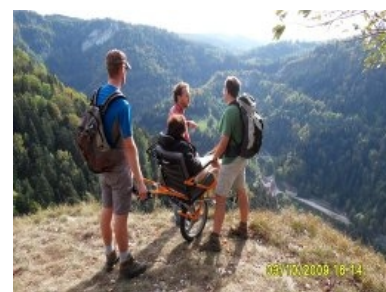
10 personnes partageaient le gîte, nous rejoignaient 4 accompagnateurs pour les balades et les repas.

Bol d'air à participé en septembre 2009 au Forum des Associations à Micropolis Besançon, organisé par le Centre 1901.