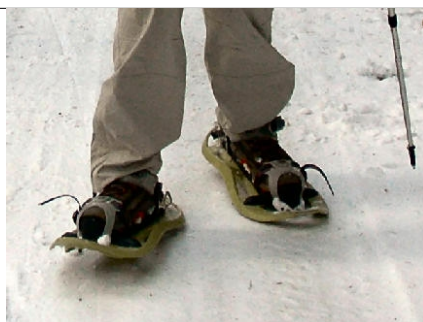
Raquettes à neige