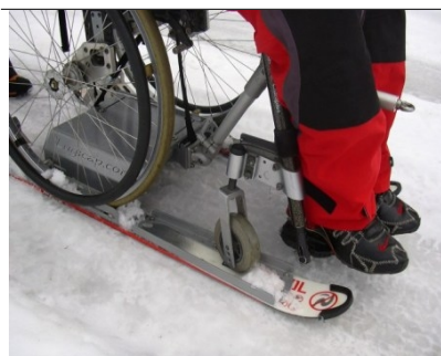
Fauteuil sur lugicap