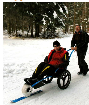
Fauteuil tous chemins Hippocampe

Chaque fois que nous en avons besoin dans l'année, nous pratiquons des prêts de matériels dans un esprit de partage, avec le club Handisport de Pontarlier Morteau Maîche et le centre APF Ferme Léonie de Saint-Laurent en Grandvaux.