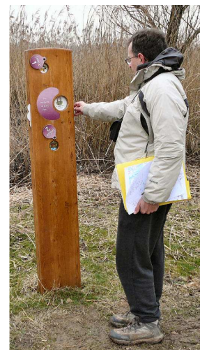
Etang Vaillant (39)

Bol d'air conduit une étude diagnostic pour le Comité Départemental du Tourisme du Jura. Il s'agit de visiter 23 sites culturels et prestataires d'activités pour mieux qualifier leur offre adaptée, les conseiller pour améliorer l'accueil de touristes handicapés et proposer au CDT des moyens d'information plus performants vis-à-vis de ces publics.