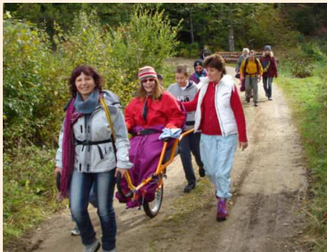
avec l'APF du Jura