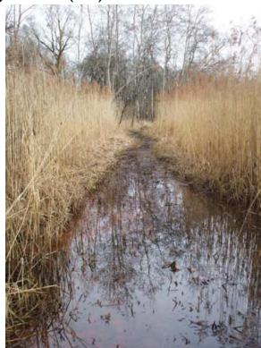
Marais de Saône (25)