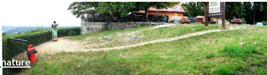
Belvédère du Regardoir (39)

Récemment, nous avons concouru pour une mission au Pôle International de la Préhistoire, dans le Périgord.