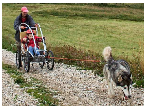
Canif-FTT, avec la Ferme des Huskies à La Pesse (39).